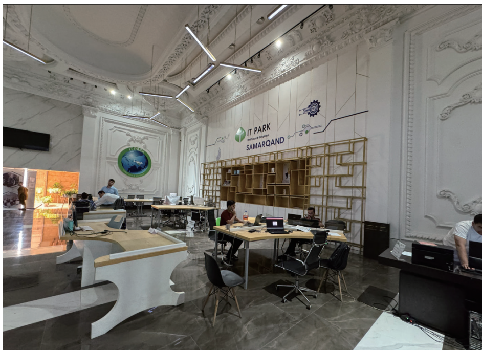
サマルカンドの ITPark、外資 10 社で 140 人が入居しており、2024 年には 1 千万ドルの輸出額になったセンター