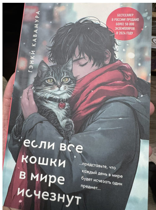
普通の路面書店で唯一見つけた日本著書は『世界から猫が消えたなら』（川村元気、2013）、 『彼女と彼女の猫』（新海誠、2016）。ともにロシア語版