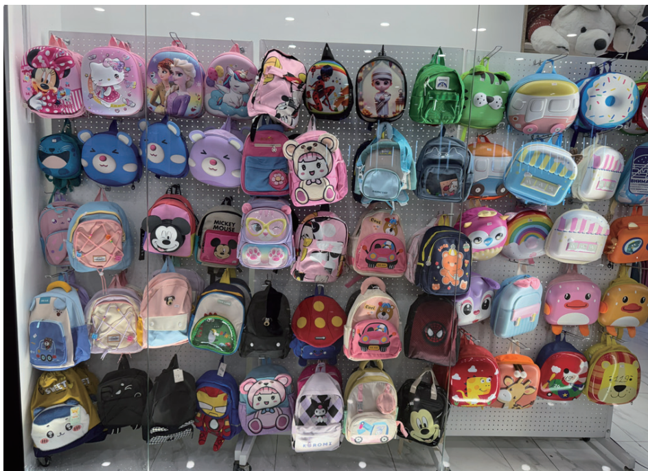
子供向けグッズは Disney、サンリオ、ちいかわなど著作権系 3 割と ふわっと名前のないかわいい動物キャラ 7 割といった印象