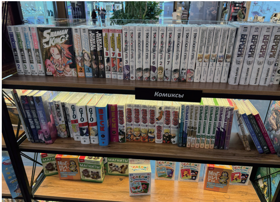
日本マンガコーナー。まとめ読みできるようにロシア語・英語の重装版が並んでいる（約3千円価格帯）