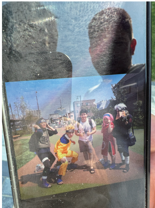
コスプレは世界を一つにする。ウズベキスタンでも NARUTO のコスプレヤーが存在する