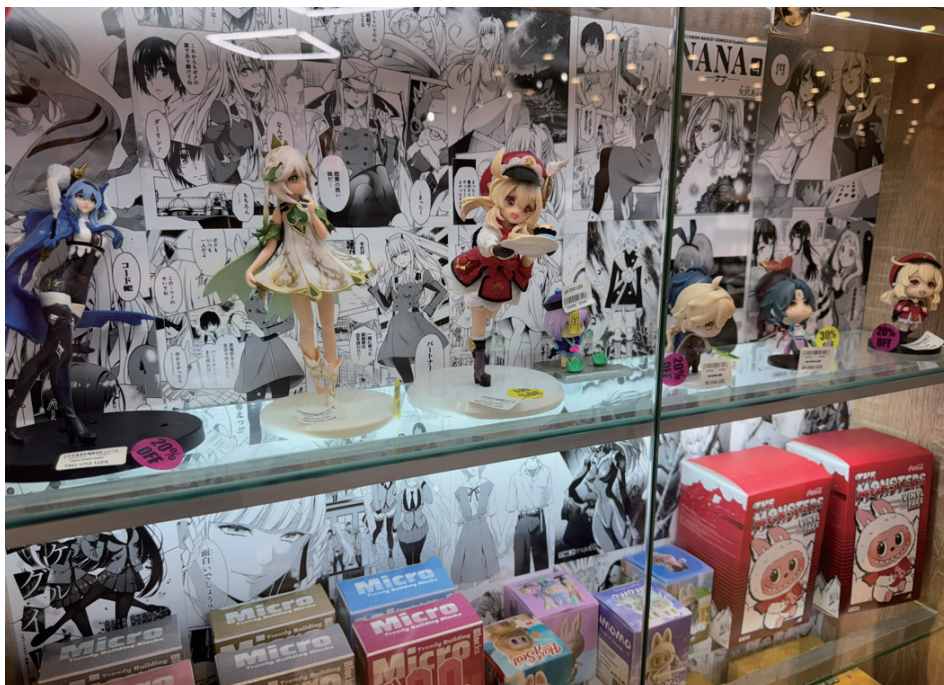
一番の売れ筋は Labubu、日本アニメのフィギュアは台座がとれていたり、原作からかけはなれた手描きの表情・頭身で質が低い完全な海賊版。並行輸入品すら少ない市場